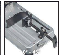
0° - 45°