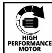
HIGH PERFORMANCE MOTOR