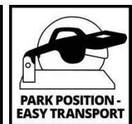
PARK POSITION - EASY TRANSPORT