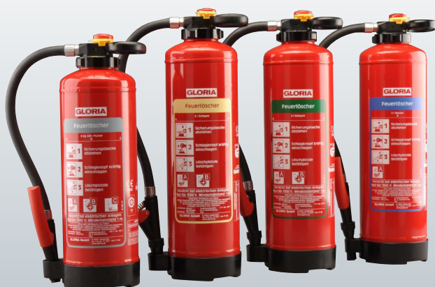
Pulver Schaum Öko-Tipp Wasser