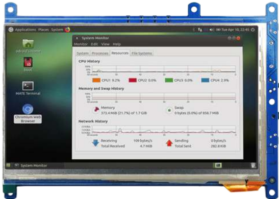
Bild zeigt Anwendungsbeispiel

Auf unserer Website www.pollin.de steht für Sie immer die aktuellste Version der Anleitung zum Download zur Verfügung.