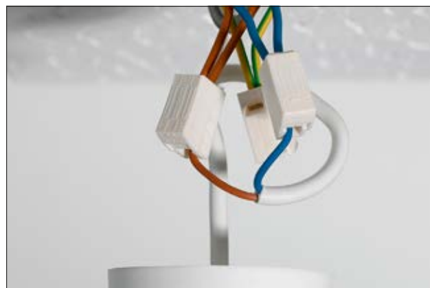
Schnelle Installation von Leuchten mit HelaCon Lux.

Die Ader auf der Ausgangs- bzw. Leuchtenseite kann sehr einfach durch Zusammendrücken des Klemmmechanismus verbunden und genauso jederzeit wieder gelöst werden. Auf dieser Seite können alle Leiterarten geklemmt werden, wodurch sich HelaCon Lux ebenfalls zum Anschluss von Geräten mit flexiblen Zuleitungen wie Rollosteuern, Ventilatoren oder ortsveränderlichen Antrieben eignet.